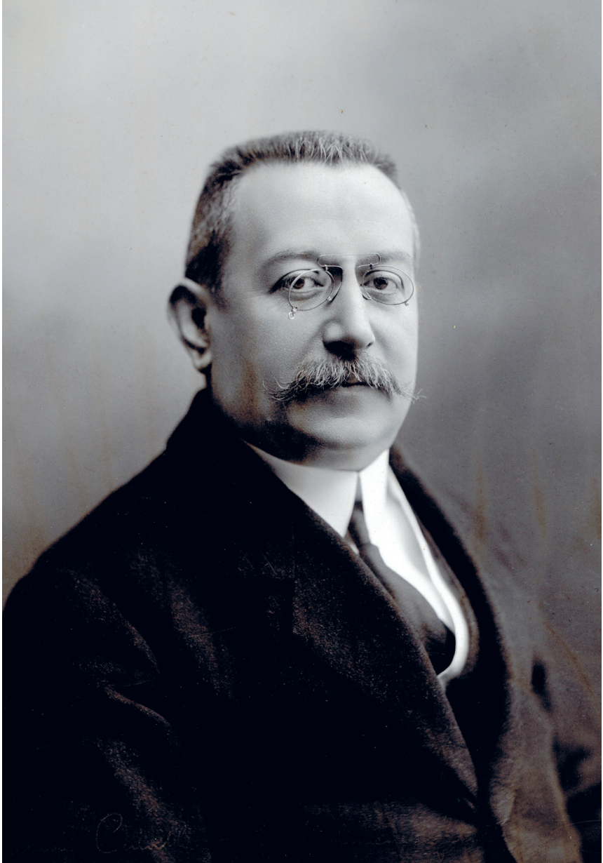
Enric Prat de la Riba. Codi de referència: ANC1-585-N-14623.