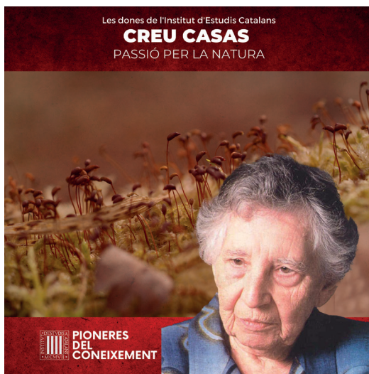
Creu Casas i Sicart, primera dona membre de l'Institut d'Estudis Catalans. Fotografia original de Creu Casas i Sicart: Galeria biogràfica de la ciència i la tècnica catalanes , https://sbcscientific.iec.cat/cientifics/casas-i-sicart-creu/ . Imatge del pòdcast de Creu Casas i Sicart: Arxiu de l'Institut d'Estudis Catalans.