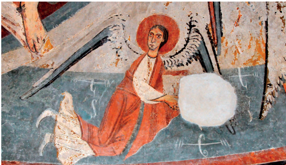
Detall de les pintures murals de l'absis de Sant Serni de Baiasca (Llavorsí, Pallars Sobirà). Font: Imma Lorés Otzet. Projecte Pirineus Romànics.