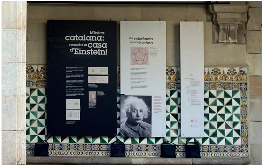
Exposició «100 anys d'Einstein a Catalunya», al claustre de la Casa de Convalescència.