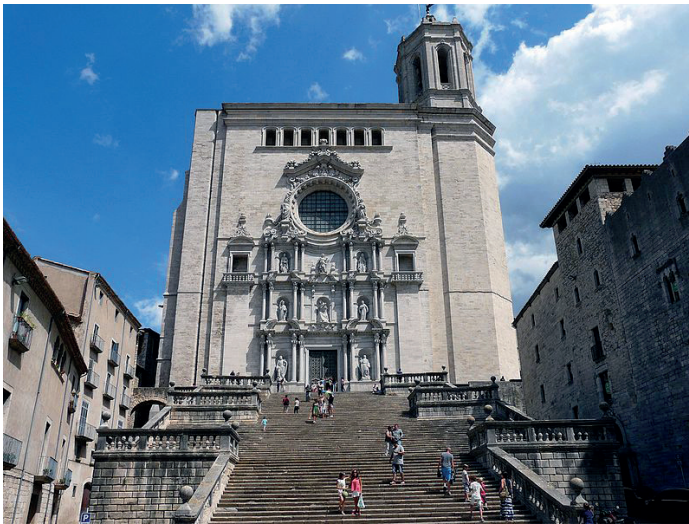
Catedral de Girona.