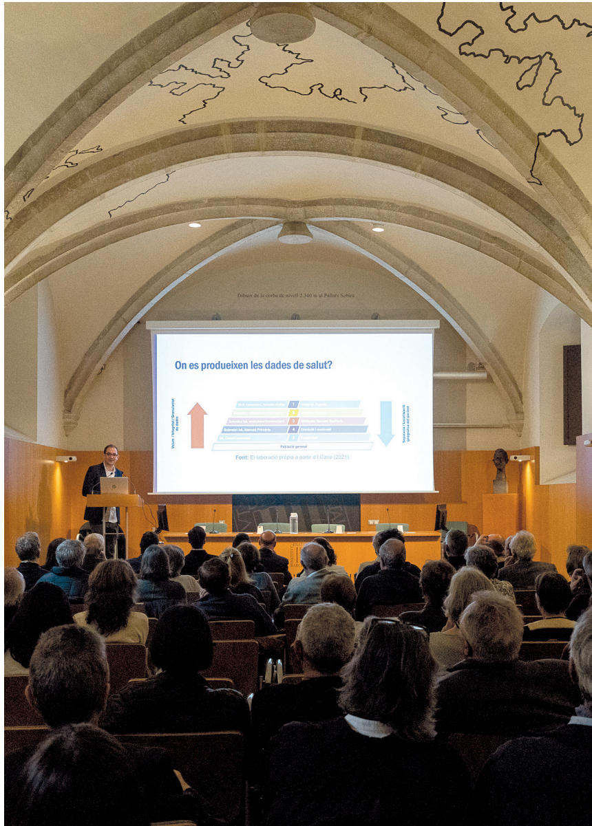
Celebració a la Sala Pere i Joan Coromines de l'Institut d'Estudis Catalans de la sessió del cicle Dimarts de ciència i tecnologia dedicada a dades mèdiques, intel·ligència artificial i salut digital (16 d'abril de 2024).